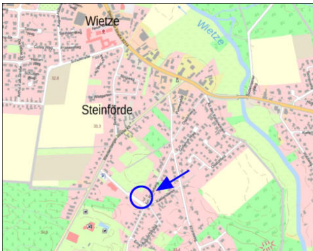
Abb. 1: Lageübersicht